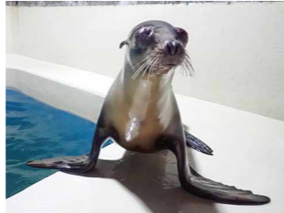
▲カリフォルニアアシカ「てまり」 (男鹿水族館から)