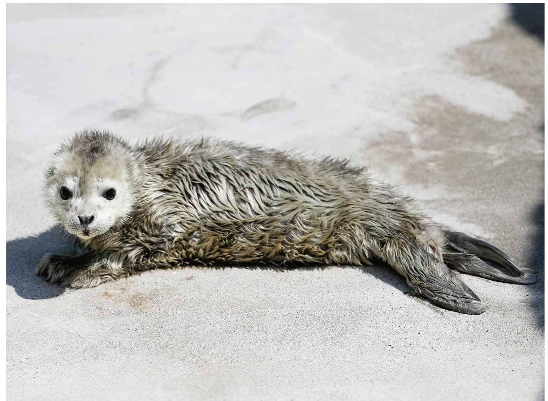
▲生後2日目(2024年3月30日撮影)