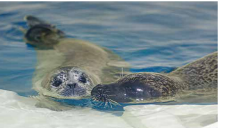
▲親子で遊泳(生後19日目)