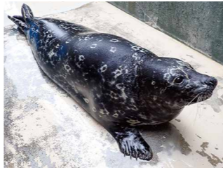
▲ゼニガタアザラシ「ピース」 (浅虫水族館から)