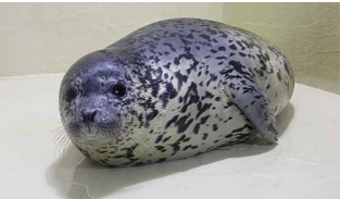
▲換毛終了(生後26日目)